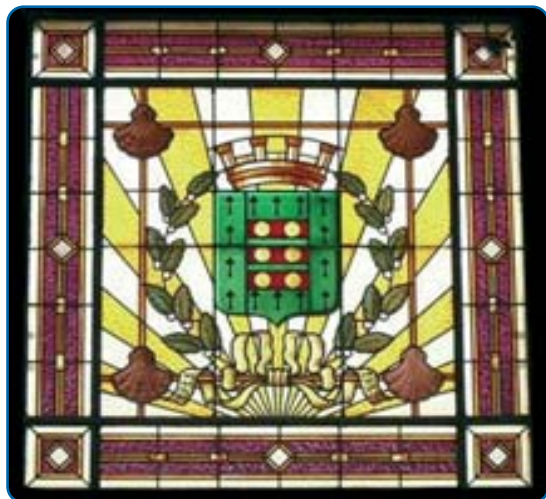
Réunion cantonale à Auberchicourt - p. 7