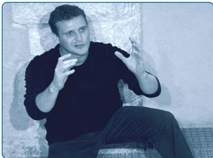
"L' Histoire du tigre" de Dario Fo - p. 7