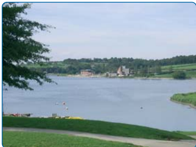
Réunion inter-cantonale au Valjoly - p 7