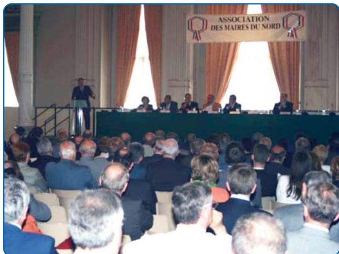
Assemblée Générale de l'Association des Maires du Nord - p 2 et 3