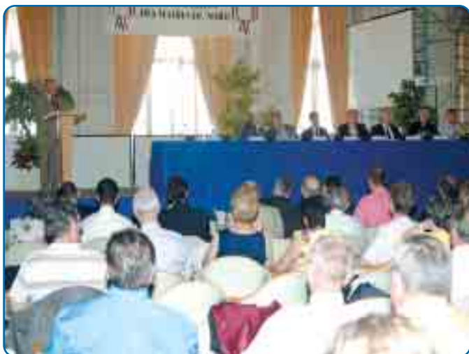
Assemblée Générale de l'Association des Maires du Nord - p2 et 3