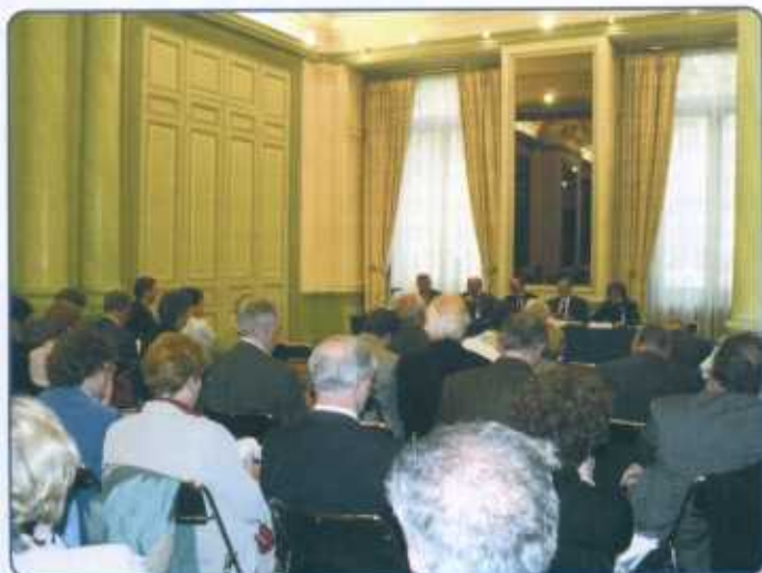
Assemblée Générale de l'A.T.D, le 23 mai 2005