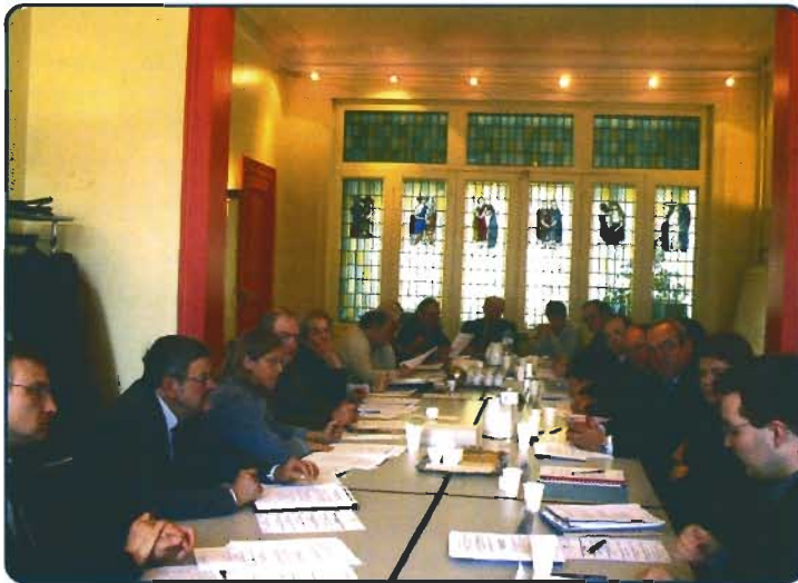
Réunion cantonale à Valenciennes - p 7