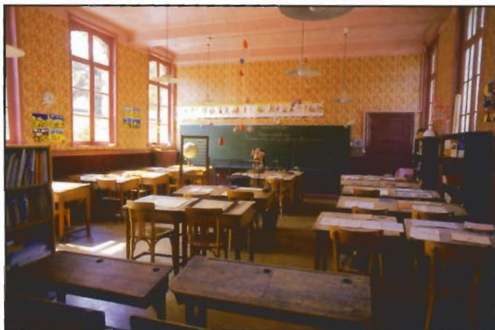
Logement de fonctions et professeur des écoles-p.6