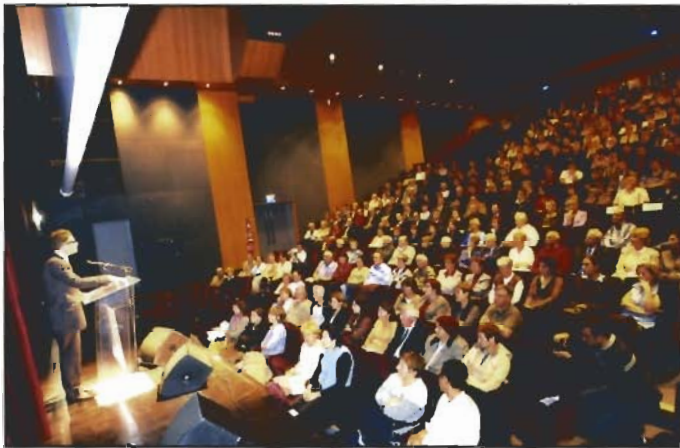
Réseau Départemental de Diffusion Culturelle - Caudry - 5 octobre 2004 - p. 7