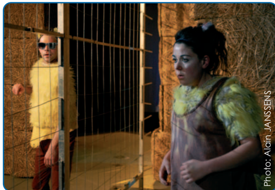
" Zoro et Jessica " - p. 7