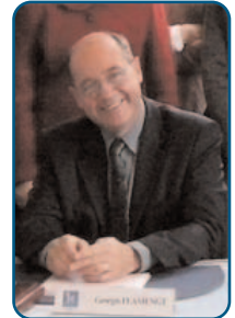
Georges FLAMENGT Président

La réunion d'information de l'ATD destinée aux élus et responsables administratifs des communes des cantons d'HAZEBROUCK-NORD et HAZEBROUCK-SUD s'est tenue le 22 septembre dernier à WALLON-CAPPEL et a suscité tout l'intérêt des participants. Le prochain numéro de " Partenaires " reviendra plus amplement sur cette rencontre.