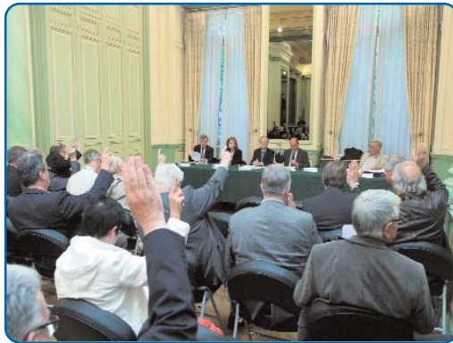
Assemblée générale de l'exercice 2010, le 20 juin 2011