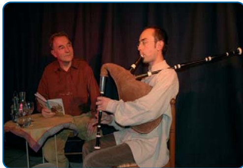
"L'homme qui plantait des arbres" - p. 7