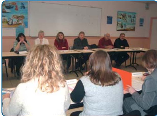
Somain, le 3 février... - p. 7