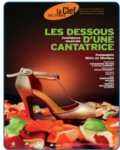
Les Dessous d'une cantatrice... - p. 7