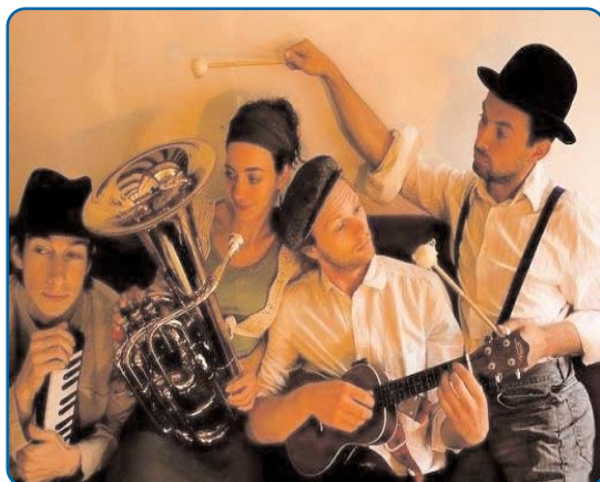
Trois roues sous un Parapluie - p. 7