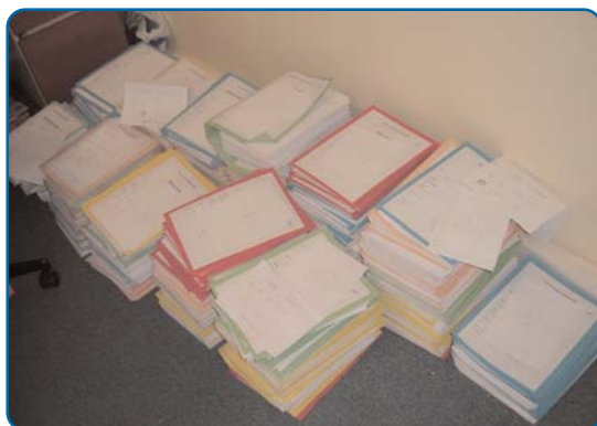
ATD, 2009 : plus de 5800 dossiers traités...