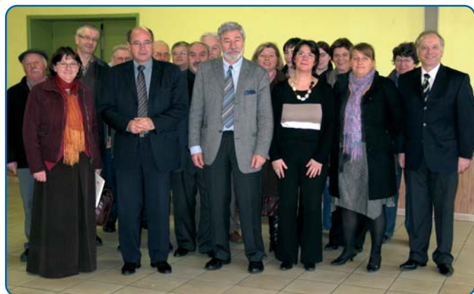
Réunion d'information. Canton de Cassel-p. 7