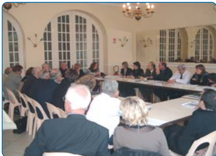
Réunion d'information avec l'ATD. Trith-Saint-Léger 13 novembre 2008 - p. 7