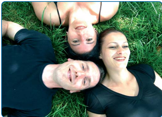
Un brin d'Barbara - p 7