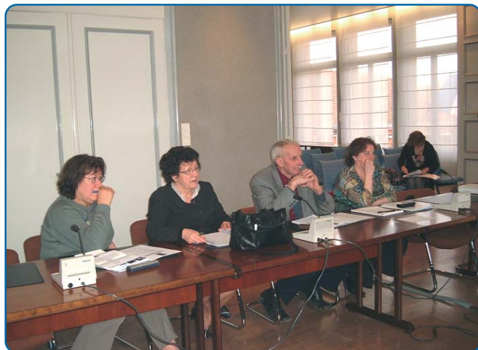
Réunion cantonale Vieux-Condé-p. 7