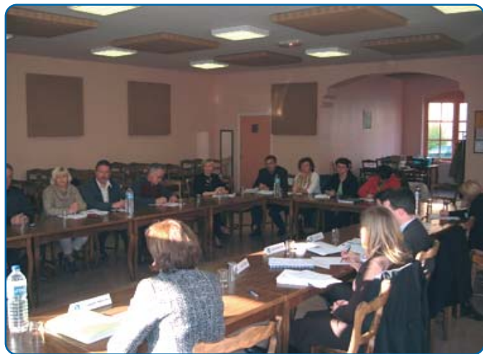
Réunion cantonale Wormhout - p. 7