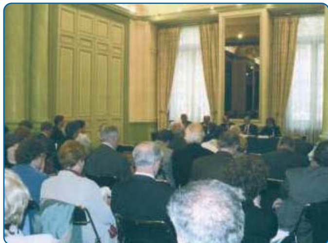
Assemblée Générale de l'ATD, le 21 mai 2007